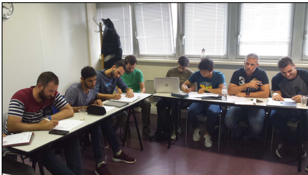
Journée conviviale, mais studieuse pour les contractuels présents lors de cette journée

Le SNEP national a créé une commission non-titulaire. Si un collègue, titulaire ou non, souhaite en faire partie, qu'il ou qu'elle n'hésite pas à nous contacter.