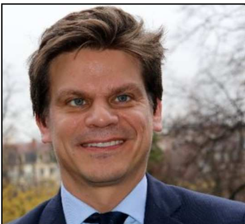
Le nouveau recteur de Toulouse

Si vous souhaitez nous faire part d'informations concernant ces sujets, n'hésitez pas à vous adresser au secrétariat académique du SNEP.